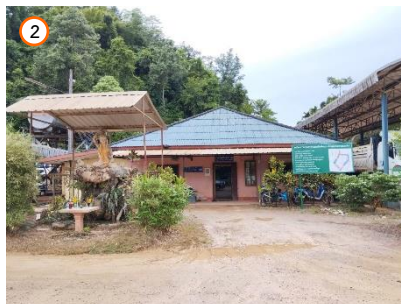
สำนักงานของโครงการ