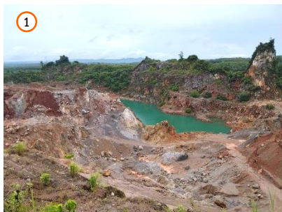
พื้นที่หน้าเหมือง