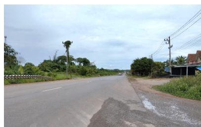
ทางหลวงหมายเลข 44