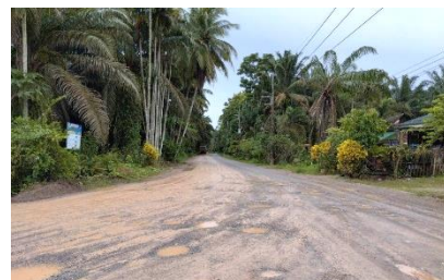
เส้นทางเข้า-ออกด้านหน้าพื้นที่โครงการ