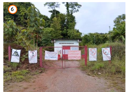
สถานที่เก็บวัดระเบ็ด