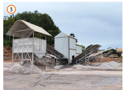
โรงโม้หินของโครงการ