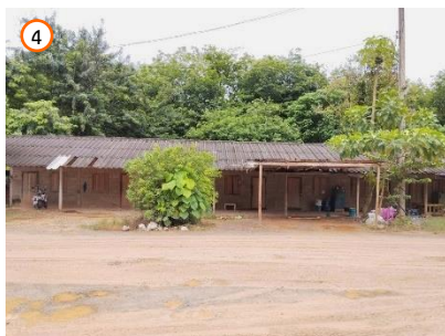
บ้านพักพนักงาน