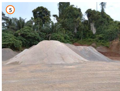
พื้นที่ลานกองแร่